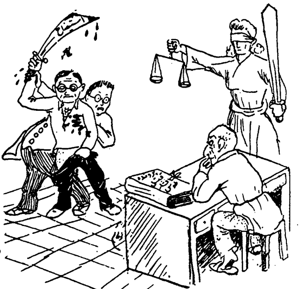
فرار از چنگال عدالت به استیضاح

چقدر دردناک است که وقتی هر یک از خواص اصیل حزب توده را بیان میکنیم به نازما میبرد شاید حزب توده حسق دارد اگر تکه ای از این نوشته را در داخل < > نقل کند و سپس بنامیت فعاشی بدهد . ملاحظه کنید از نجواس اصیل حزب توده <بی وطنی> است . بی شک این در قاموس انسانهای عادی آنها که از اندکی منبومی عادی و معمولی دارند این است ناسراسفش است ولی چه میتوان کرد متاسفانه این واقییتی است که حزب توده بی وطن است بلکه توده ای اگر این حرف را از شما بشنود سرخ میشود و اگر نوشته میشود اعتراض میکند و شروع به استدلال میکند وطن و وطن پرستی را برای من و شما توضیح میدهد . بینه در صفا ۶