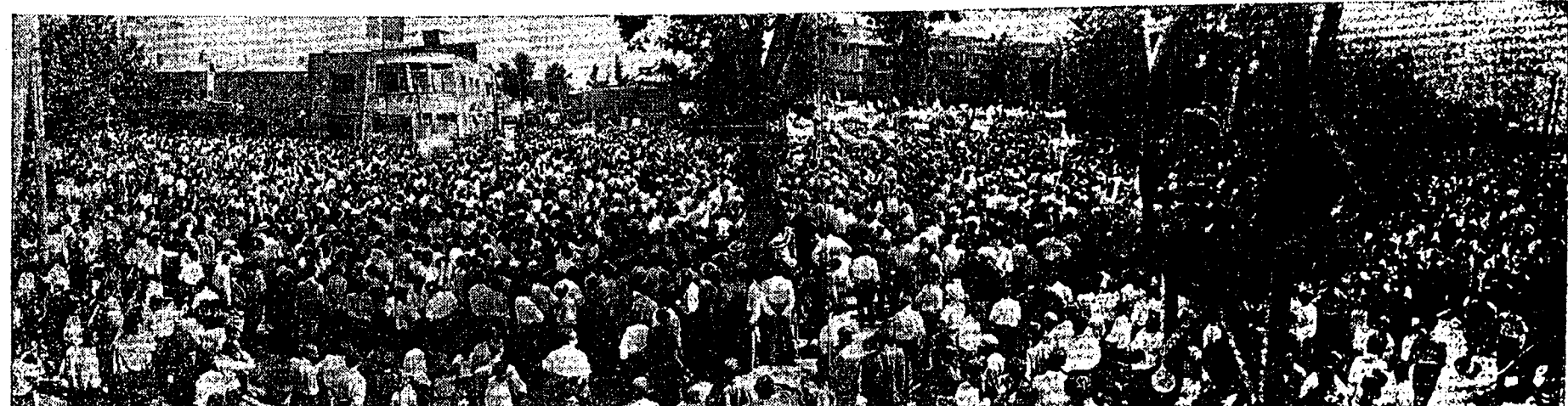
نظارات با عظمت مردم تهران به یادبود شهیدان قیام با عظمت سیام تیر - پرروز بار دیگر ملت ایران ثابت کرد که اراده مردم مائوق با یکامهای میت حاکمه است.