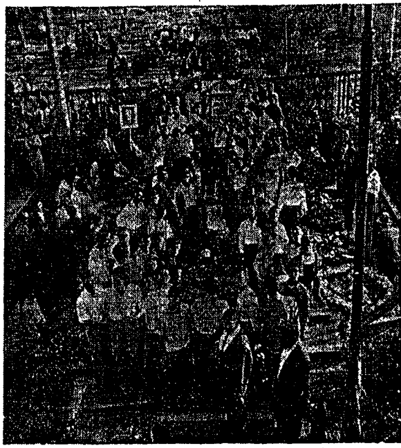
عصر روز جمعه رفقای حزبی ما دسته گلهایی به روی تیر سربازان کتاف نهضت ملی و شهیدان راه آزادی گذاشتند