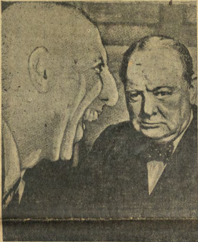
آرژون که چرچیل را از خوردن خون ملت‌ها خندان بودند ملت ایران در خشم و خشونت تمام غرطه‌ور بود. آرژون که چرچیل را ماتم زده و پریشاسته مصدق‌ها و ملت‌ها از گرفتن انتقام دلشاد و سروراند