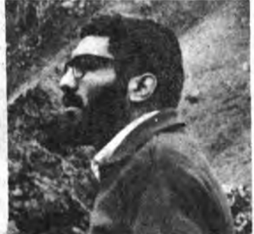
بنام خدای شهیدان

در صورتی که آمریکا جنایت کار دستش از آستین صدام و حزب بعث کافر بیرون آمده در جایی که امام خمینی جنگ بین ایران و بعث عراق را جنگ بین اسلام و کفر و آنرا یک رحمت میدانند. در شرایطی که ادا ما این جنگ به شیوه مردمی و اسلامی ضربه به منافع شیطان بزرگ و صهیونیسم در منطقه میزند و صبح روشن قدس از طریق این جنگ و از خون جوانان صالح وطن سر برون خواهد آورد. من با دلسی آکنده از کینه در این جنگ شرکت میکنم و در این مسیر خدائی هیچ چیز ندارم جز جان خودم که هدیه ای است ناقابل برای رهائی مردم مستضعف.