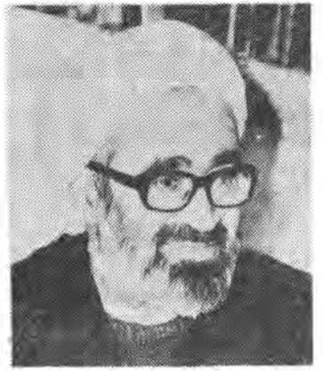
بقیه از صفحه ۱