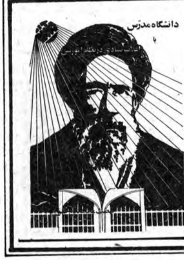
کتاب "دانشگاه مدرس"

شهید مدرس بخوبی توطئه انگلیس را درک کرده بود و در نتیجه احمد شاه را که مخالف قرارداد ۱۹۱۹ بود، بر رضا خان که ادعای آزادیخواهی داشت ترجیح میداد. مخالفت مدرس در مقابل این توطئه (قرارداد ۱۹۱۹) و جمهوری رضا شاه زمانی صورت گرفت که بسیاری از نیروها اعم از مذهبی و غیر مذهبی از جمهوری رضا شاه