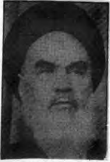
عالم محضر خداست

ما باید خودمان را در محضر خدا ببینیم در همه وقت و خدای تبارک و تعالی حاضر و ناظر است بر اقوال ما بر قلوب ما بر همه چیز حاضر است و در محضر او واقع میشود .