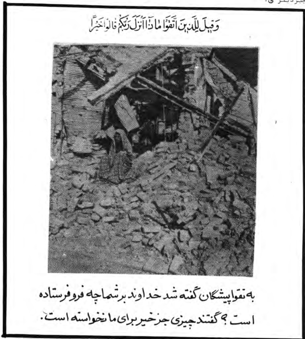
وَقِيلَ لِلَّذِينَ اتَّقَوْا مَاذَا أَنْزَلْنَا إِلَيْكُمْ فَأَلَّوْا خَيْرًا

کیهان ۶۳/۱۲/۲۳ نمایندگان تهران طی نامه ای به است حزب ا... اطمینان میدهند که سر نوشت بیرد حق علیه باطل را بزودی در میدان جنگ تعیین خواهند کرد.