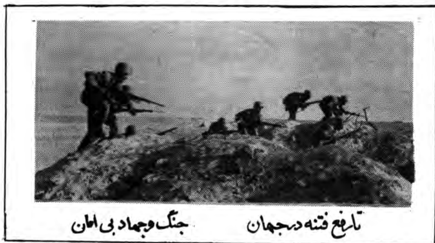
تاریخ فتنه در جهان جنگ و جهاد بی امان

آیتا... العظمی منتظر فرمودند: که چرا مجلس در مسئله جنگ ورود کافسی ندارد؟ از فرماندهان برای توضیح مسائل جنگ باید دعوت کنیم تا اشکالات سریعتر رفع شوند، چون جنگ با وضع استکبار در مقابل حاکمیت یا بیان ناپذیر است.