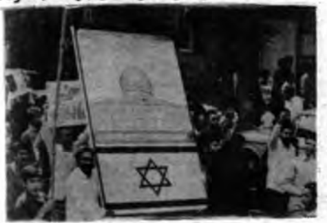
رادیو اسرائیل به انقلاب اسلامی ما را مارک جنگ طلب میزند

حافظ این نظام بوده است همان نظام راب زمین میزند، ولی جوهره سازش نا پذیر انقلاب دست از سر اسرائیل بر نمیدارد.