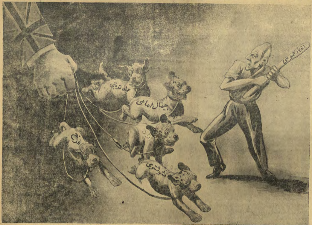
این سگهای دشیانلوی، ولگرد لندنی فقط با چوب دستی این شبان باوفا و جسور رخنه شعر آهذد شد

در مسجده کوفه جبهه فاتح شیریا ضربت ششیر برآورد از ای نمون شکفته قد و کفایت سلطنت معاویه سنگین گردید و دستگامی ناطق اطالم معتقد برآمید ها و معونتهای اجتناع مسلمان ترکز یاغت! معاویه برض ف سن مذهبی آفرزند مهدل وصنت اراده و نالیجب خود را بر سازمان اجتناع و توانسن پاک معنهی سلطت گردا پرزید سفیه و نالیجب رود بروز در ایجاد محیط اشخان و رفع آزادی ولنو قوانین اسلام و دواج محیط فسادگوشا ترمشه. تصعبات نفون فامیلی بطوری چشم زیردرا بسته بودک برای معو آسار و مظاهر ایدی زشیر از هیچ عمل سلطیانه و احقانه ای خود داری نیگردد! روانایام تنها سد شکست ناپذیری که موج امینده و چربانان دستگناه سلطنت اموی با آن تضاد میگردد از این بودک برای بجای اسلام موجودیت ایران در مدینه بر معوذ حسین این علی می- چرخید! چنگ سرد و تبلیغات طرفین پایان یاغت و ساحل آرام و گرم فرات انظر نبرد دوجبه بود ک پلک دسته برای حق و غای حق و استعلا حق ششیر کشیده دسته دیگر برای قنای حق و بروی حق ششیر نشان میداد و ز کمان داناتا گوش کشیده و سینه کسی را که از پستان ذرها شیر خورده و در مکتب قهرمان اجداد تربیت یافته بود، هدف گیری می- نمود! عمر این سعفا، ششیرن ذی الجوشن ستان بن اسر باسیر زیاد و غولی ذلخشان بیرحی هستند که تاریخ بشریت بر آنها لنر زده و خامه مورخین نام آن ها را در ذیر مرزبندی و ذرات ثبت نوده است ذیرا اینها برای استعجاب پناههای ماعظمت مستندانه برید و برای حکومت ری و کوفه، نام آزادی قلب شریف ترسن فرزندان آزاده بشریت ششیر فرور کوله باسم اسلام بختبره پاک پیشوای اسلام دفته گذاشتند!