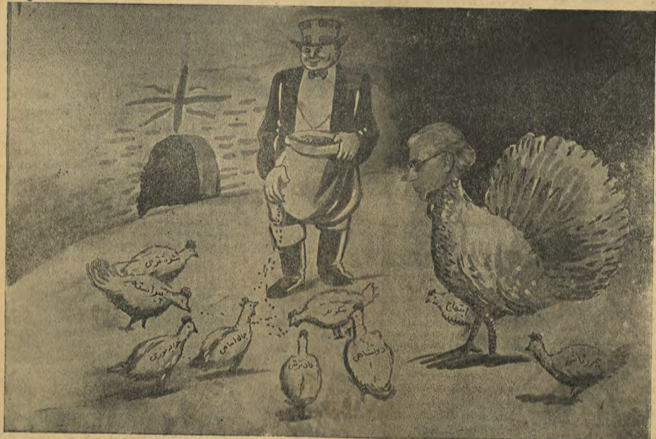
این جوجه بوقلمو نهایی رنگا رنگ انگلیسی محصول کارخانه جوجه کشی سعادت آباد «آغا» است !!

اینها هستند که در میان لغت و دشنام نسل حاضر غلط می خوانند ، طاق لهد ایپاست که باغشت بدنامی پانجاه شده و دوزیر ناسزا و اهانت تاریخ شکسته می شود ! سطوح مامدهات و جلات فرزنداد کسایت مارا پاره پاره نموده و معنویت جهاد و وطن پرستی نسل ایرانی را منقرض ساخته با دست لایک و منوس همین افراد رقیبه شده و از منس سپاه و مشتم همین رجال سپاه و تراوش یافته است ! مکتب پرورش دهنده ای که هر کس جاسوسی غاوری میانه توجه می شود از پنجایا پیر ، لادهای قبیله که بار شیات شود را با بیان رسانیده و حق خود را در صحنه تاریخ سیاسی ایران با نودها در پناه پنجه های مسوم و مظلوم کوروا طرق بگرد و تولید و ایجاد افراد خان و عناصریکه بتوانند با موادی ضمن بروج ایام و منطق زمان نظریات لنن را تحویل نمایند گوش میگرد ! و روی همین استقلال بود ، هنگامی که سید شیاه خان و پست باغلم کنده اش از فرزاداد و تونالدوله در روز نامه رعد دفاع میگرد و می نوشت « و تونالدوله غذایت خیرهدها که کتور در نجات وادی میماند که اصحاب او با بیرونی معدایت میگرد که تاود است و از او اصان تیره ذذات و پشی برون کپنه و بقاء نخست وزیری ارتقا رعد ! ماور میان تپکاران تاریخ و در رجال تاسی میگرد و ذهن ما بنام اغلب از زمامداران لنتی آشناست منتها هیچ یک با نده سید شیاه ناسنجیب و قلی در خدمت با شمداد و شیات بوغن باشقاری نگرده و تا این پایه بروج استقلال و شهیت دمکراسی و احسانات می ماضرت زده است !