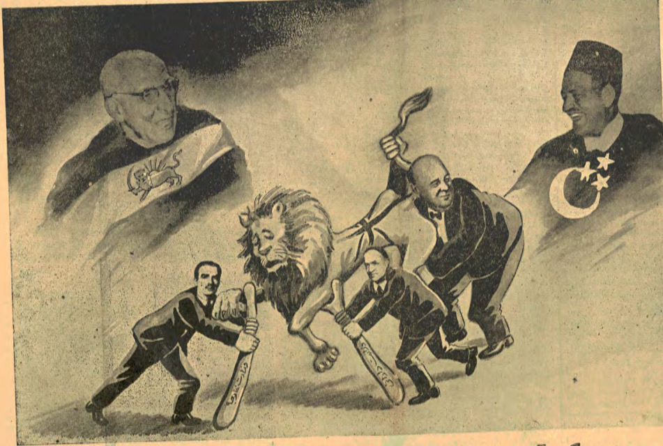
زمن بگوی چرچیل و ایدن و ولز که شیر مرده زاهرم کجا پیا خرید ۱۵