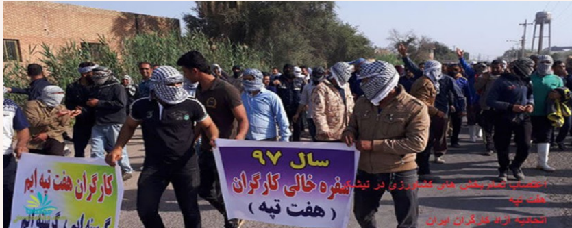
اولین اعتصاب و تظاهرات تمام کارگران بخشهای کشاورزی شرکت نیشکر هفت تپه در سال جدید