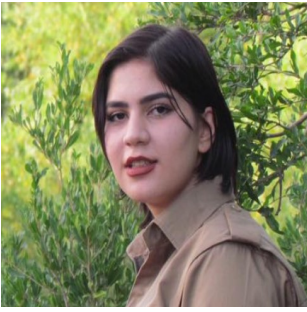
تینا خلیفه ای