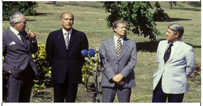
(از راست) هلموت اشمیت، جیمی کارتر، ژیسکار دستن و جیمز کالاهان در جزیره گوادلوپ محل برگزاری نشست ژانویه ۱۹۷۹

خمینی شد چنین الترناتیوی برای سرکوب آن انقلاب تحت پوشش "انقلاب اسلامی"! همان نیروهایی این هیولای جانی را به عنوان "رهبر انقلاب" جلوی صحنه ۵۷ کشیدند، بیشترشان پیشتر زیر بغل رژیم شاه را گرفته بودند و ساواکش را تعلیم میدادند. آنها که به یک کمر بند سبز در کش و قوسهای جنگ سرد نیاز داشتند، و برای "اسلامی" کردن انقلاب ۵۷ هزاران نفر از دیپلماتها و مستشاران نظامی غربی تا ژورنالیستهای مزدور دموکراسی را سازمان دادند و ماهها پول گرفتند و تلاش کردن "مردم را قانع کنند" تا از یک سنت عقب مانده و کپک زده یک "رهبری انقلاب" و یک آلترناتیو حکومتی برای جامعه شهری و تازه صنعتی ایران سال ۵۷ بسازند. دقیقاً همان اتفاقاتی که امروز دارند چهرهای ضد انقلابی تر از سران خود جمهوری اسلامی را با صف کردن در کنار پمپئو و کنفرانس ورشو و غیره دارند بطور مضحکی همان تاریخ را تکرار میکنند و اسمشان هم اپوزسیون جمهوری اسلامی است، همانطوری که گویا خمینی هم اپوزسیون شاه بود!