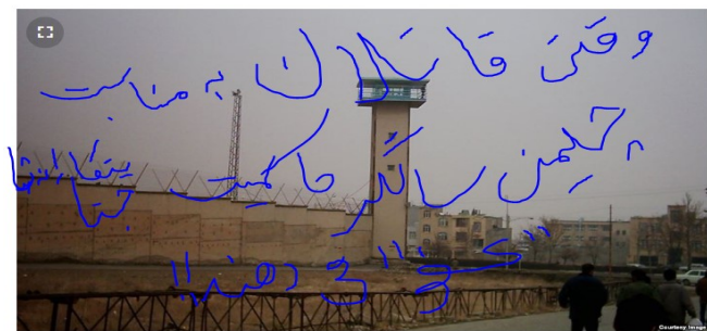
زندان رضایی شهر

حزب سوسیالیست انقلابی ایران از طبقه کارگر و زحمتکشان جامعه، از زنان و دانشجویان، از فرهنگیان و جوانان، از سالمندان و کارکنان، از رانندگان و بازاریان و از هر کسی که برای خود حرمت و ارزشی قائل است اکیدا میخواهد با هیچ بهانه و تحت هیچ فشاری در نمایش جنایتکارانه "چهلمین سالگرد پیروزی انقلاب اسلامی ایران" این رژیم شرکت نکنند. این صف، صف قاتلین و عوافریشان دزد و فاسد، صف آدمکشان و مرتجعین، و صف نظامی است که تک تک سران و مقاماتش باید به دلیل کشتار گسترده مبارزین و شکست خونین انقلاب سال ۵۷، به دلیل جنایت بیوقفه علیه کارگران، زنان، جوانان و مردم آزادیخواه، بازداشت، زندان و محاکمه شوند، و باید به شدیدترین شکل ممکن مجازات گردند! آزادیخواهان! صف آزادیخواهانه و انسانیت خود را از صف دشمنان خود و از صف جنایتکاران ضد آزادی و ضد انسانی نظام جمهوری اسلامی در روز ۲۲ بهمن و در همه مناسک مربوط به جمهوری جنایتکار اسلامی جدا کنید! اجازه ندهید از شما و فرزندان شما به نفع خود بهره برداری نمایند، باید متحدانه مشت محکمی به دهن این نظام کثیف و ضد انسانی کوبید! و در راهبیمانی و مراسمهایش شرکت ننمود! زنده باد انقلاب آزادیخواهانه سال ۱۳۵۷، ننگ و نفرت بر "چهلمین سالگرد انقلاب اسلامی"!