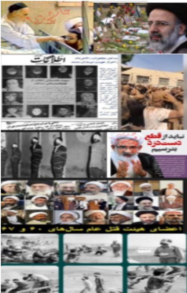
بهمین ۱۸، ۱۳۹۷

موافقت رهبر جمهوری اسلامی با عفو گروههایی از محکومان