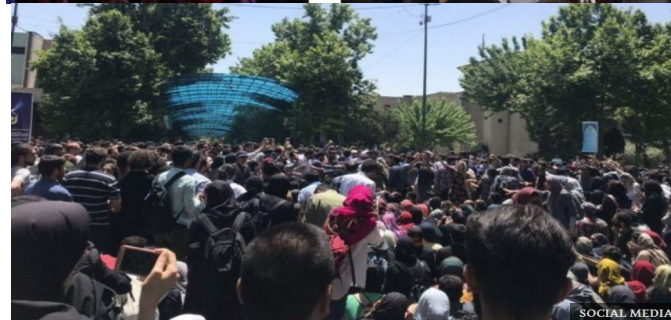
تجمع از مقابل پردیس دانشکده هنرهای زیبای دانشگاه تهران آغاز شد