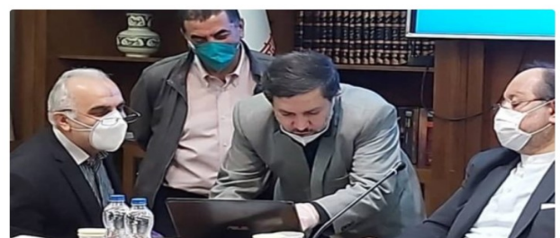
اتلاف سه جانبه برای تداوم سرکوب مزدی کارگران

نماینده کارفرمایان در شورای عالی کار روز چهارشنبه ۱۳ فروردین به خبرگزاری دولتی جمهوری اسلامی (ایرنا) گفت پیشتهاد کارفرمایان کماکان موکل کردن افزایش دستمزد به پایان بحران کروناست. او گفت: