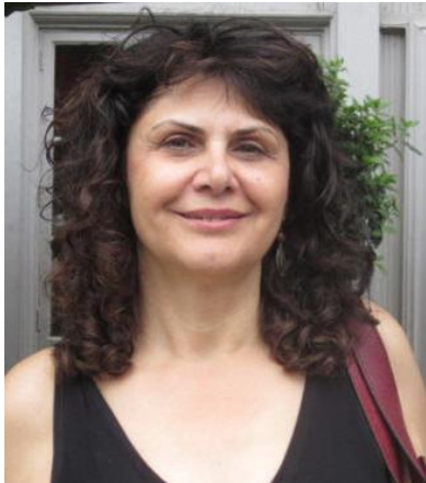
دیگر فراخوان داده شد.

شنبه صبح از طلوع آفتاب بیش از ۱۰۰ هزار نفر در استانبول دست به اعتراض زدند. همچنین در چندین شهر بزرگ دیگر از جمله آنکارا و ازمیز اعتراضات شکل گرفت. در آنکارا، معترضین کوشیدند به مقابل ساختمان پارلمان بروند که با ممانعت پلیس مواجه شدند. خواست