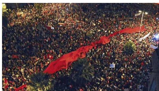
Demonstration i Tunisien mot regjeringen.