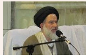
حاج آقای کتک خورده