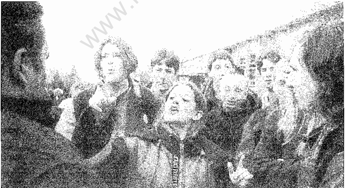
دختران دانش آموز در آمریکا، مردسالاران را محکوم می کنند

نقد این نظرات بلحاظ دیگری نیز اهمیت دارد. اینها نظرات رایج در جامعه است. بهمین دلیل نقد آنها، تنها نقد نظرات این حزب نمی باشد. مبارزه کمونیستها علیه این تفکرات و برای ترویج افکار صحیح پرولتاری در مورد مسئله زن و سقط جنین، یک حرکت خلاف جریان است. کمونیستها نسبت به مسئله ستم بر زن برخوردی کیفیتا متفاوت از برخوردهای رایج و سنتی ارائه می دهند. اگر قرار است در حرکت