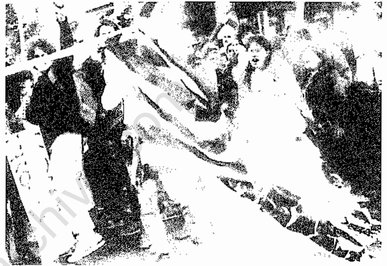
زنان در تظاهرات دفاع از حق سقط جنین، پرچم آمریکا را به آتش می‌کشند

لابد می‌پرسید ربط اینها به مسئله سقط جنین چیست؟ بسیار ربط دارد. نکته اینست که شما در پی تسویه حساب قطعی با مناسبات اجتماعی اقتصادی حاکم و ایده‌های برخاسته از این مناسبات نیستید. بخاطر همین بناگزیر به تبیینی نادرست از موضوع سقط جنین (که با مسئله زنان ارتباط لاینفک دارد) و ارائه طرحهایی رفرمیستی برای این مسئله کشیده می‌شوید. چگونگی برخورد به این مسئله ربط دارد به اینکه شما با چی، برای چی، و چگونه مبارزه می‌کنید. در برنامه حزب شما انقلاب بمعنای دگرگونی تمامیت مناسبات کهنه اقتصادی و اجتماعی و ایده‌های برخاسته از این مناسبات جایی ندارد. پس بسیار طبیعی است که بر سر جوانب مختلف رهائی زن خط بورژوائی را جلو بگذارید.