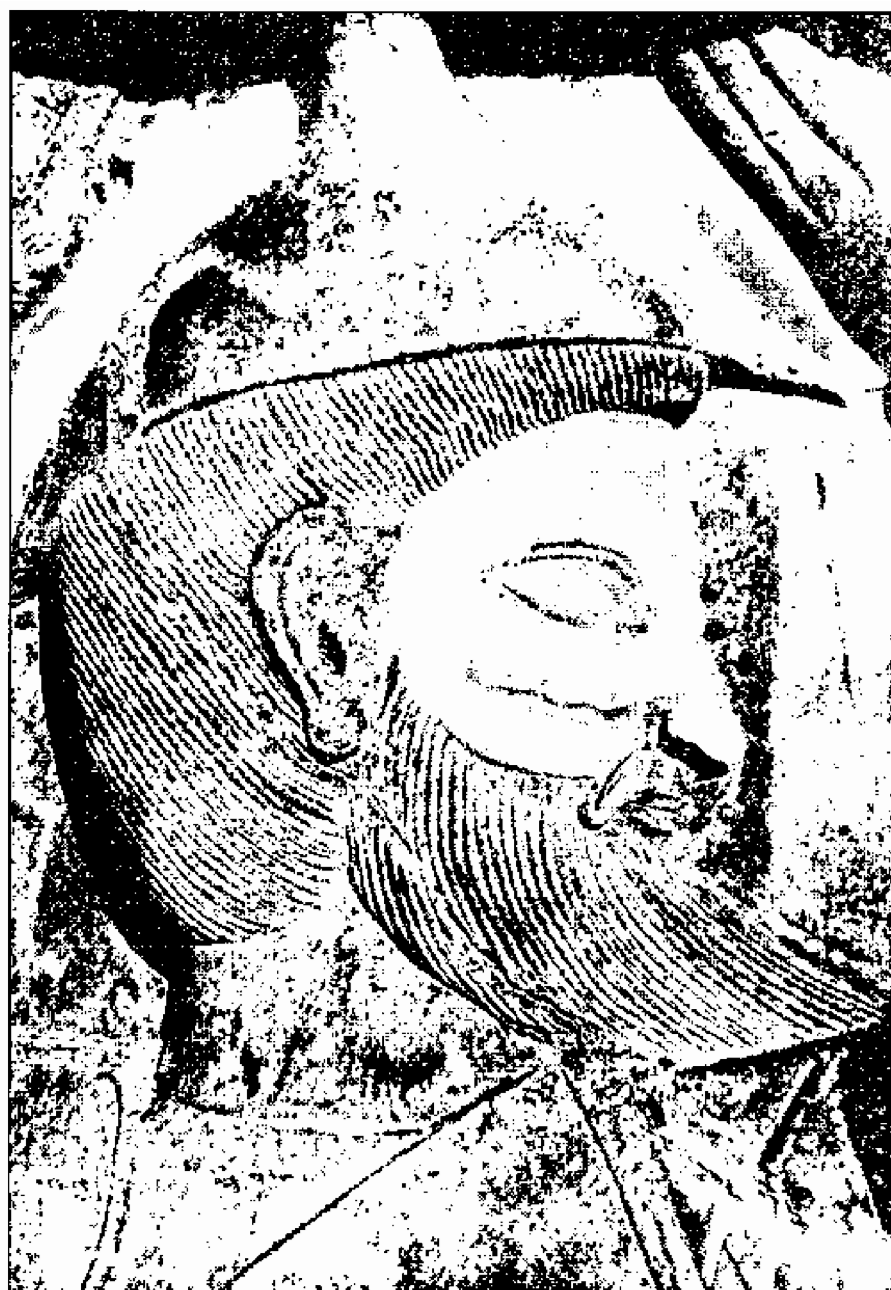
از هلنی‌های تراکیه