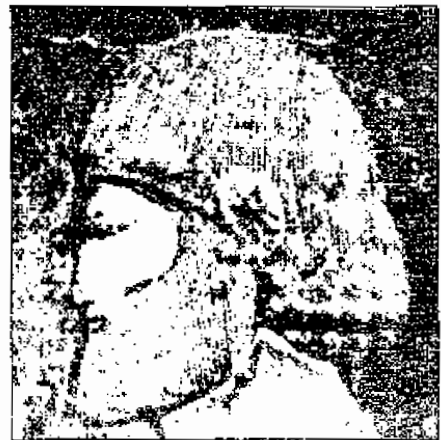
مصری نودی بایلی