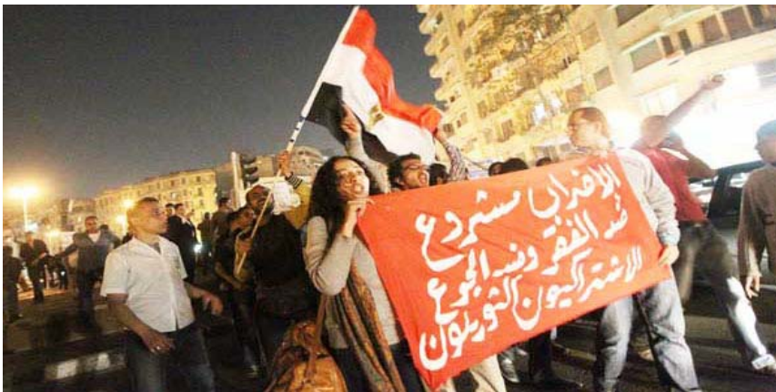
تصویری از تظاهر کنندگان در حال حمل پلاکاردی که بر آن نوشته: "اعتصاب علیه فقر و گرسنگی قانونی است."

موارد خشونت و یا توقف تولید قابل اجراست و اینکه " ما به حق اعتصاب ، تحسن و تظاهرات اعتقاد داریم، اینها اساس انقلاب ما بوده و تا آجا که به بلوا و آشوب دامن نزنند، ممنوع نخواهد بود!"