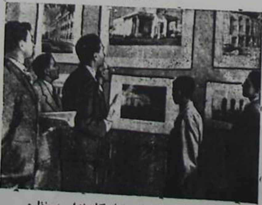
تبریزده کی سووت دائمی نمایشگاهیندن بر منظره

نمایشگاهین بویوک میزین اوستو نده سووت و ایران و آذربایجاندا چیخان روزنامه لر ، مجله لر هر دینده قویولموش ایدی . هامو ساکنایک ایله بویوک اشتیاقیله فراتنه مشغول ایدیلر . بر طرفدن با کودان ویریلن کسرت و خبرلری جماعت نمایشگاهین خار چیئنده ایشد بر دیلر . بودور نیم سووت نمایشگاهیندا گوردو کوریم . بونمایشگاه مننه جوج باخشی بیر تاثیر باعشلا دی . من تبریز اهالیسینن و تماشاچیلا رین بو حسن رغبت و سونینجینی یازیمدا اولدوغی کیمی گوسته ره بیلمه دیگم اوچون محترم آذربایجان روزنامه سیندن عذر ایستوب بو مقاله مین روزنامه درج اولماسین خواهش ایده ردیم . ۵ صفر ۱۳۲۵