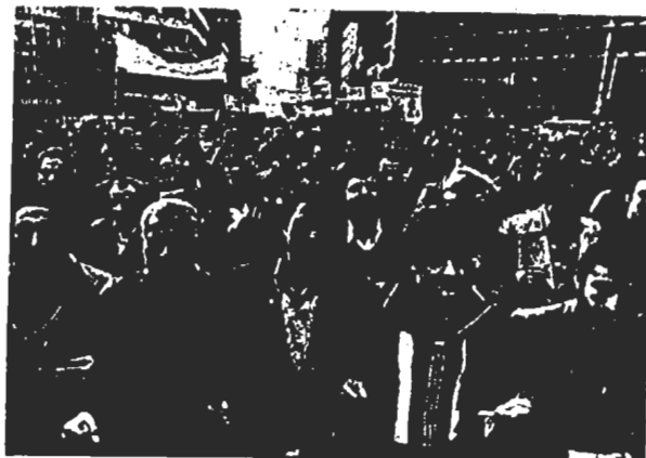
در صفحه ۲