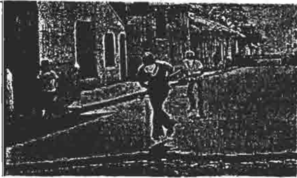
بعد از نیکاراگوئه نوبت ال سالوادور است.

تن رازخی کردند. امپراتور کنندگان با کم کم چریک های چپ به مقاومت پرداخته و به دانشگاه ها و سان سالوادور پناهنده شدند. در روز سوم بهمن ماه راهپیمایی عظیمی به تشییع جنازه شهدای این نبرد پرداختند.